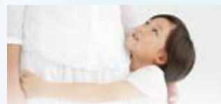
小児がんの陽子線治療が 保険適用になりました

※PETと各種画像検査、血液検査を組み合わせ、がんの発見率を より高めることを目的とした総合的ながんドッグコースです。