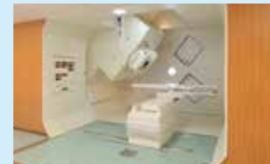
陽子線治療装置(回転ガンジー照射室)