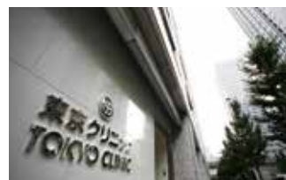
東京クリニック (東京都千代田区大手町)

TEL.03-5318-3711 〒165-0022 東京都中野区江古田三丁目14-19 FAX.03-5318-3712 URL http://www.kaigo-egota.com/ E-mail : egotanomor@mt.strins.or.jp