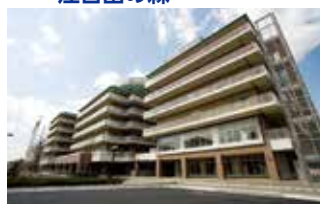
東京総合保健福祉センター 江古田の森 (東京都中野区)

TEL.044-322-9991 〒215-0026 神奈川県川崎市麻生区古沢都古255 FAX.044-322-8688 URL http://www.shinyuri-hospital.com/