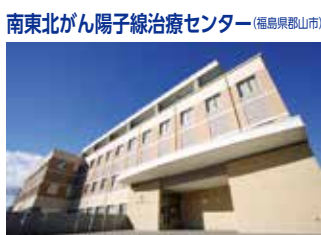
南東北がん陽子線治療センター(福島県郡山市)

TEL.024-934-5322(代) 〒963-8563 福島県郡山市八山七丁目115 FAX.024-934-3165 URL http://www.minamitohoku.or.jp E-mail : info@mt.strins.or.jp