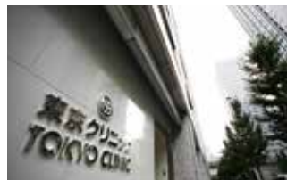
東京クリニック (東京都千代田区大手町)

TEL.03-5318-3711 〒165-0022 東京都中野区江古田三丁目14-19 FAX.03-5318-3712 URL http://www.kaigo-egota.com/ E-mail : egotanomor@mt.strins.or.jp