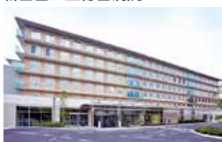
新百合ヶ丘総合病院 (神奈川県川崎市)

TEL.03-3387-5421 〒165-8906 東京都中野区江古田3-15-2 FAX.03-3387-5659 URL http://www.tokyo-hospital.com/ E-mail : tokyo-hospital@mt.strins.or.jp