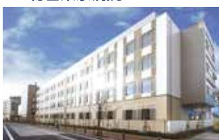
総合東京病院 (東京都中野区)

TEL.024-934-3888(代) 〒963-8563 福島県郡山市八山七丁目172 FAX.024-934-5393 URL http://www.southerntohoku-proton.com/