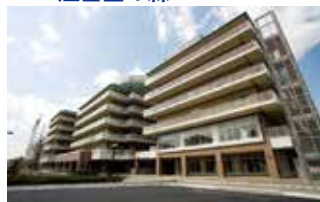
東京総合保健福祉センター 江古田の森 (東京都中野区)

TEL.044-322-9991 〒215-0026 神奈川県川崎市麻生区古沢都古255 FAX.044-322-8688 URL http://www.shinyuri-hospital.com/