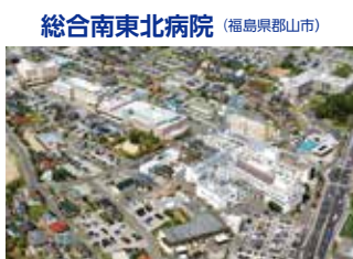
総合南東北病院 (福島県郡山市)

TEL.024-934-5322(代) 〒963-8563 福島県郡山市八山七丁目115 FAX.024-934-3165 URL http://www.minamitohoku.or.jp E-mail : info@mt.strins.or.jp