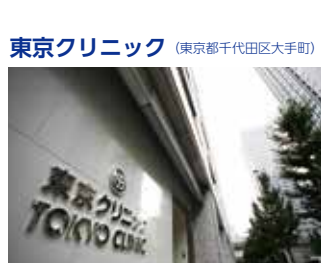
東京クリニック (東京都千代田区大手町)

TEL.03-5318-3711 〒165-0022 東京都中野区江古田三丁目14-19 FAX.03-5318-3712 URL http://www.kaigo-egota.com/ E-mail : egotanomor@mt.strins.or.jp