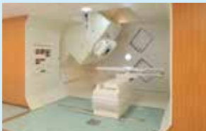
陽子線治療装置(回転ガントリー照射室)