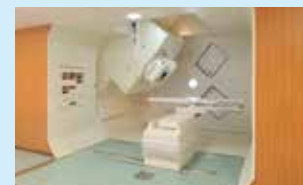
陽子線治療装置(回転ガンジー照射室)