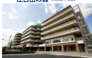
東京総合保健福祉センター 江古田の森 (東京都中野区)

TEL.044-322-9991 〒215-0026 神奈川県川崎市麻生区古沢町255 FAX.044-322-8688 URL http://www.shinjuri-hospital.com/