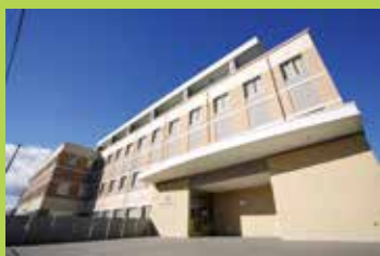
南東北がん陽子線治療センター

2015年に喉のあたりに違和感があり病院を受診。医師から「ステージ4の中咽頭がん」を宣告される。余命幾ばくもないなか、妻が探してきた陽子線治療を行うことに。2ヶ月半の治療を経て退院。現在も俳優業を中心に活躍中。