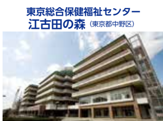
東京総合保健福祉センター 江古田の森 (東京都中野区)

TEL.044-322-9991 〒215-0026 神奈川県川崎市麻生区古沢都古255 FAX.044-322-8688 URL http://www.shinyuri-hospital.com/