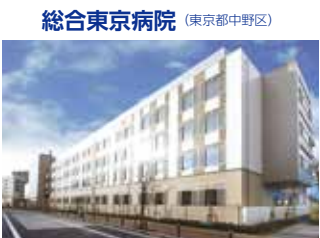
総合東京病院 (東京都中野区)

TEL.024-934-3888(代) 〒963-8052 福島県郡山市八山七丁目172 FAX.024-934-5393 URL http://www.southerntohoku-proton.com/