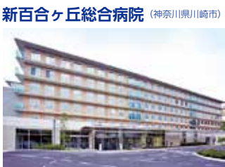
新百合ヶ丘総合病院 (神奈川県川崎市)

TEL.03-3387-5421 〒165-8906 東京都中野区江古田3-15-2 FAX.03-3387-5659 URL http://www.tokyo-hospital.com/ E-mail: tokyo-hospital@mt.strins.or.jp