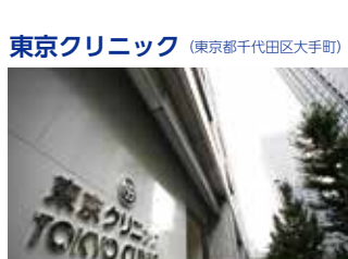
東京クリニック (東京都千代田区大手町)

TEL.03-5318-3711 〒165-0022 東京都中野区江古田三丁目14-19 FAX.03-5318-3712 URL http://www.kaigo-egota.com/ E-mail: egotanomori@mt.strins.or.jp