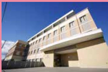
南東北がん陽子線治療センター