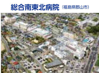
総合南東北病院 (福島県郡山市)

TEL.024-934-5322(代) 〒963-8563 福島県郡山市八山田七丁目115 FAX.024-934-3165 URL http://www.minamitohoku.or.jp E-mail: info@mt.strins.or.jp