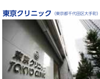
東京クリニック (東京都千代田区大手町)

TEL.03-5318-3711 〒165-0022 東京都中野区江古田三丁目14-19 FAX.03-5318-3712 URL http://www.kaigo-egota.com/ E-mail: egotanomori@mt.strins.or.jp