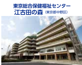
東京総合保健福祉センター 江古田の森 (東京都中野区)

TEL.044-322-9991 〒215-0026 神奈川県川崎市麻生区古沢町255 FAX.044-322-8688 URL http://www.shinyuri-hospital.com/