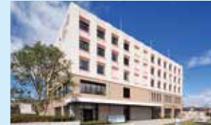
南東北BNCT研究センター