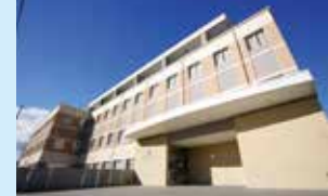
南東北がん陽子線治療センター