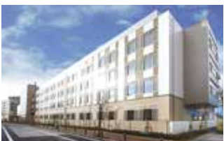
総合東京病院 (東京都中野区)

TEL.024-934-3888(代) 〒963-8052 福島県郡山市八山七丁目172 FAX.024-934-5393 URL http://www.southerntohoku-proton.com/