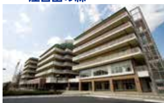
東京総合保健福祉センター 江古田の森 (東京都中野区)

TEL.044-322-9991 〒215-0026 神奈川県川崎市麻生区古沢都古255 FAX.044-322-8688 URL http://www.shinryuri-hospital.com/