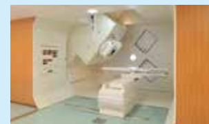
陽子線治療装置(回転ガントリー照射室)