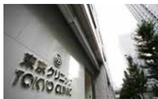
東京クリニック (東京都千代田区大手町)

TEL.03-5318-3711 〒165-0022 東京都中野区江古田三丁目14-19 FAX.03-5318-3712 URL http://www.kaigo-egota.com/ E-mail: egotanomori@mt.strins.or.jp