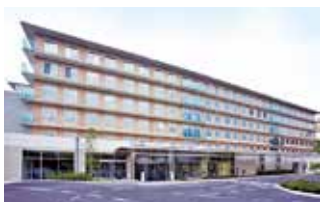
新百合ヶ丘総合病院 (神奈川県川崎市)

TEL.03-3387-5421 〒165-8906 東京都中野区江古田3-15-2 FAX.03-3387-5659 URL http://www.tokyo-hospital.com/ E-mail: tokyo-hospital@mt.strins.or.jp