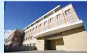
南東北がん陽子線治療センター