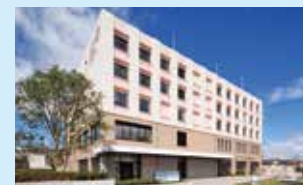
南東北BNCT研究センター