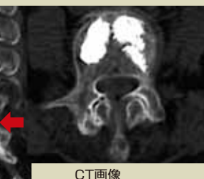
CT画像 (骨そしょう症による 腰椎圧迫骨折に対する バルーン後彎形成術)