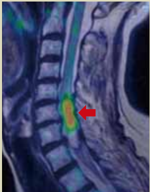
PETとMRIの合成画像 (脊髄腫瘍)