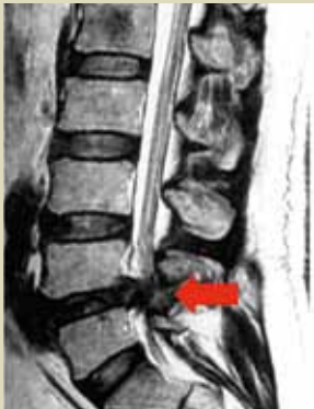
MRI画像 (腰椎椎間板ヘルニア)