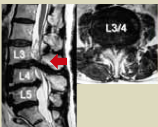
MRIおよび3次元CT画像 (腰椎変性すべり症)