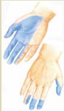
右手のしびれ (毛根管症候群)