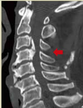
CT画像 (頸椎後縦靭帯骨化症)