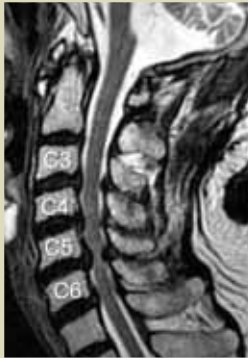
MRI画像 (頸椎症性脊髄症)