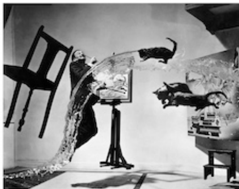
フィリップ・ハルスマン《ダリ・アトミクス》1948