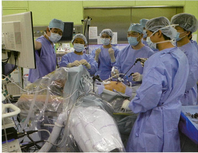
緊張しながら腹腔鏡による手術を見守る高校生ら

医師を目指す福島県内の高校1年生を対象にした第4回「地域医療体験セミナー」は8月20日(火)午前8時半から郡山市の総合南東北病院で開かれ、25人(男子12人、女子13人)の生徒が医師の仕事に理解を深めるとともに、目標実現への意欲を高めました。