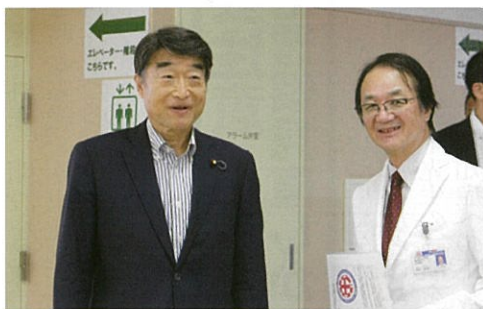
深谷院長(右)の説明を受ける根本厚労相

10回目となる「よさこいソーラン大競演会」には、北は青森、南は神奈川から過去最多の20チーム約400人が出場しました。この日のため練習を重ねてきた各チームはお揃いの衣装を身にまとい、夏の太陽が照りつける中、華やかで躍動感あふれる舞を繰り広げました。