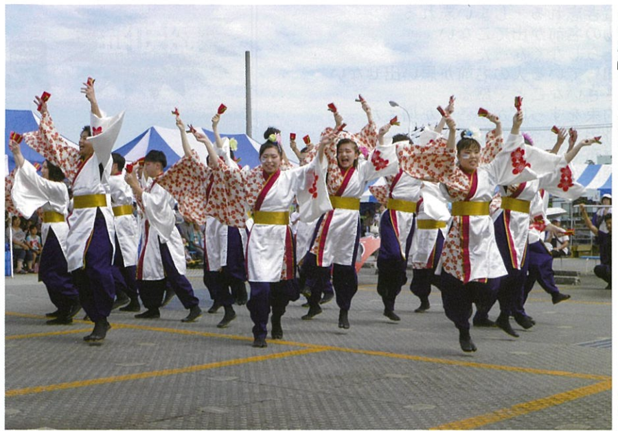
厳しい暑さの中、躍動感あふれる舞を披露する出場チーム

総合南東北病院の「第28回病院まつり」は8月18日(日)午前10時から、郡山市八山田の同病院の立体駐車場2階で開かれ、南東北グループの職員による「よさこいソーラン大競演会」などが行われ、来場者を楽しませました。実行委員会の主催。