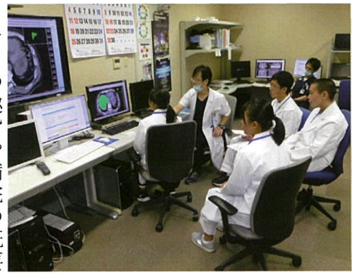
放射線治療のシミュレーターを体験する高校生

このうち外科班は胃がんの切除手術、心臓血管外科班は鼠径ヘルニアの手術の見学に臨みました。いずれも腹腔鏡による手術。医師と同じく手術室用の衣服に着替えた生徒たちは、入念に洗剤で手洗いたしゴム手袋を装着。緊張した表情で手術の開始から終了までを見守りました。引き続き両班の生徒は当院が導入している手術支援ロボット「ダ・ヴィンチXi」も見学、機械の