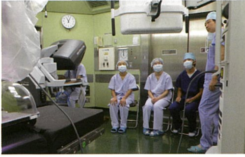
手術支援ロボット「ダ・ヴィンチ」を見学する高校生

医師を目指す福島県内の高校1年生を対象にした第4回「地域医療体験セミナー」は8月20日(火)午前8時半から郡山市の総合南東北病院で開かれ、25人(男子12人、女子13人)の生徒が医師の仕事に理解を深めるとともに、目標実現への意欲を高めました。