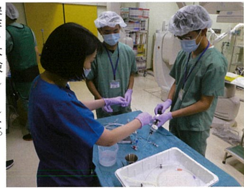
心臓カテーテルの器具の取り扱いを学ぶ高校生

このほかの班は外傷センターでの模擬体験、診療の現場見学、放射線治療のシミュレーター体験、内視鏡検査の見学などを行いました。昼には第5会議室で合同のランチオンセミナーが開かれ、医師から福島県内の医療状況、医師になるまでの道のりや学習法、医師としての体験談や仕事のやりがいなどを聞きました。午後からも班ごとのプログラムに沿って研修が行われ、5時に終了しました。生徒からは「医師はコミュニケーション能力も大切と感じた」「医師以外のスタッフの役割も重要で、医療は医師だけでは成り立たないと思う」などと率直な感想が寄せられました。