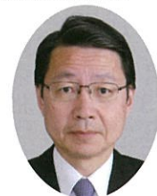
東北医療クリニックは「もの忘れ外来」を開設しま