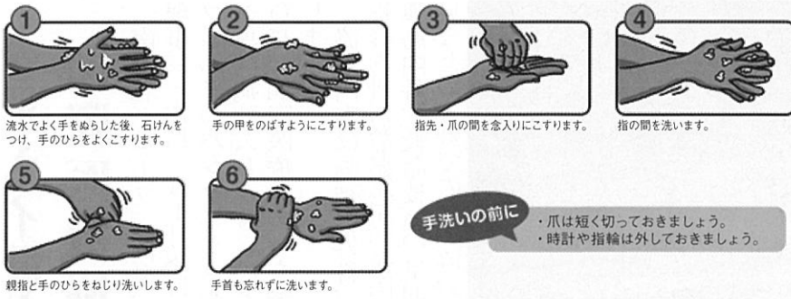
1 流水でよく手をぬらした後、石けんをつけ、手のひらをよくこすります。