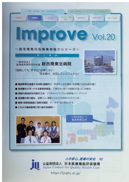
本院が紹介された「Improve」第20号

URL: http://www.minamitohoku.or.jp E-mail: pr@mt.strins.or.jp