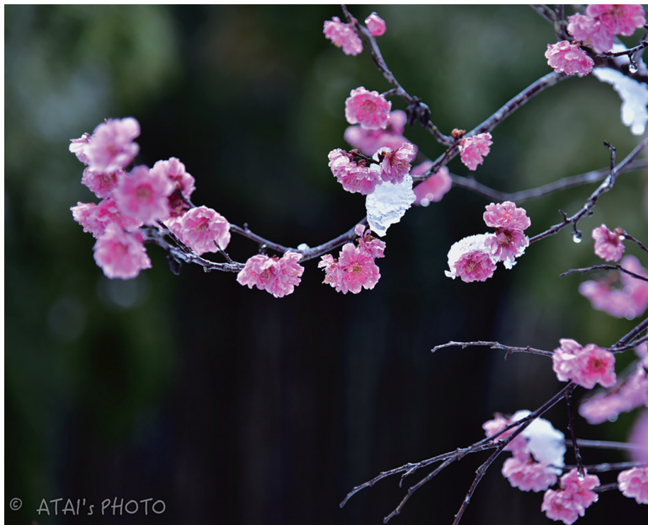
撮影データ：2020年3月 郡山市西田町 Nikon D750 + AF-S NIKKOR 24-120mm f/4G ED VR

【三寒四温】 梅は中国原産とのことですが、「花よし、香りよし、果実よし」と三拍子揃い古来より愛されてき