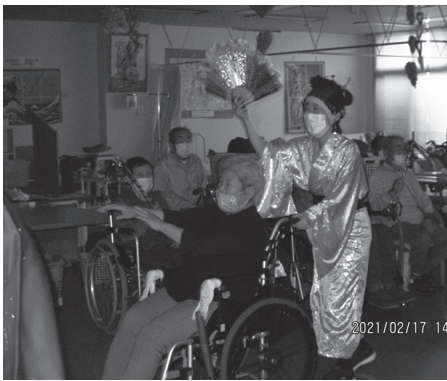
「バレンタイン感謝祭」を楽しむ利用者さん

祭」を開催しました。通所の職員が利用者さんに日頃の感謝を込めて、様々な仮装をしてダンスを披露しました。職員のダンスに利用者さんも笑顔で手拍子を取ったり、職員の見習いと一緒に踊ったりと、とても盛り上がりました。「踊り上手だったよ」「すごく楽しかった、ありがとうね」「来年も楽しみにしているよ」と嬉しい言葉をたくさんいただき、職員も「頑張った準備した甲斐があった」と嬉しさをおみしめていました。今後も皆さんが行事を楽しみに来ていただけたら嬉しいです。