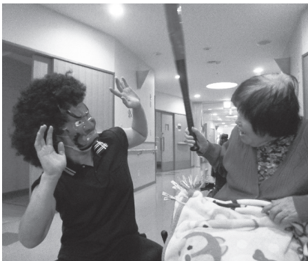
金棒を奪い鬼退治する利用者さん

を行いました。南東北ロイヤルライフ館には赤鬼と青鬼が出現し、館内の各棟を回りました。利用者さんは、豆に見立てたお手玉やボールを「鬼は外、福は内」の掛け声と共に力いっぱい投げつけ、鬼退治。鬼の金棒(プラスチック製バット)を奪って、鬼をやりこめる強者の利用者さんもありました。