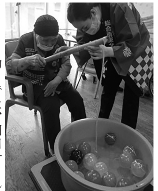
水ヨーヨー釣りに挑戦

楽しいイベントの最後に、利 用者さん一人一人の願いごとを 短冊に書いてもらい、各棟のホー ルに飾りました。皆さんの願い ごとがかないますように。 ヨヨー釣りでは、利用者さん が職員と一緒に、たらいの中か ら水ヨーヨーを釣り上げました。 釣る度に「難しいなあ」「やっと 釣れた」などの声がかえり、盛 り上がりしました。