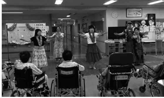
フラダンスを披露する職員たち

機能パッド めたい紙おむつ・昼用高止 ▽Cセット 必要に応じて 高機能パッド(夜用) パンツ用装着パッド・夜用 トIIパンツタイプ紙おむつ・ 夜用高機能パッド▽Bセッ むつ・昼用高機能パッド・ トIIテープ止めタイプ紙お 7枚) 【紙おむつセット】▽Aセッ パジャマ・肌着(週3着) バスタオル・フェイスタオル パジャマ(週7枚)▽BセットII パジャマ(週3着)バスタ オル・フェイスタオル(週 【入院セット】▽AセットII パジャマ・肌着(週3着) バスタオル・フェイスタオル パジャマ(週7枚)▽BセットII パジャマ(週3着)バスタ オル・フェイスタオル(週