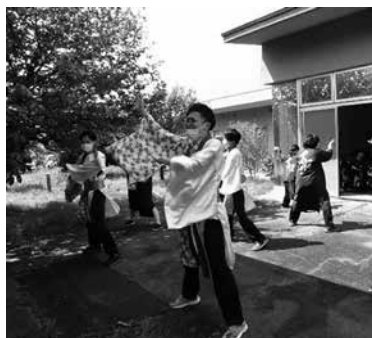
職員がよさこい演舞

その後、職員が「南中よさこい」の演舞を披露しました。演舞中は利用者さんにも一緒に掛け声を発してもらい、「ソーラン、ソーラン」「ドッコイシヨ、ドッコイシヨ」と盛り上がりました。夕方には、中庭で花火を観賞しました。パチパチパチと花火が上がると「わー、きれい」「見て見て」と歓声が上がりました。