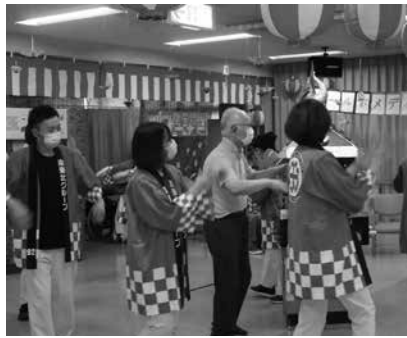
盛り上がったうねめ踊り

◆利用者さんもうねめ踊り ゴールドメディアでは8月、2日間にわたり「通所リハビリ夏祭り」を開催、利用者さんが「ゲーム屋台」や「うねめ踊り」を楽しみました。