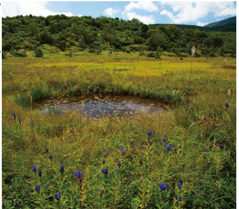
撮影データ：2019年9月15日 福島市土湯温泉町 Nikon D800+NIKKOR 24-120mm F4G f/8.0 絞り優先オート .PL フィルター・手持ち撮影

【秋色の湿原】 福島県で一番有名な観光道路と言えは、多くの人が磐梯吾妻スカイラインを挙げると思います。自家用車で容易に（とは言ってもカーブが多いので注意ですが）行くことが出来て、車窓から季節ごとに変化