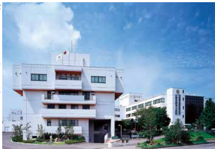
創立40周年を迎えた総合南東北病院