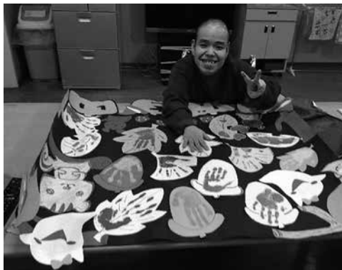
作品用に手形を取る利用者さん

別の棟では、手形と足形で動物を作り、十二支の干支を制作しました。利用者さんは、自分の手形・