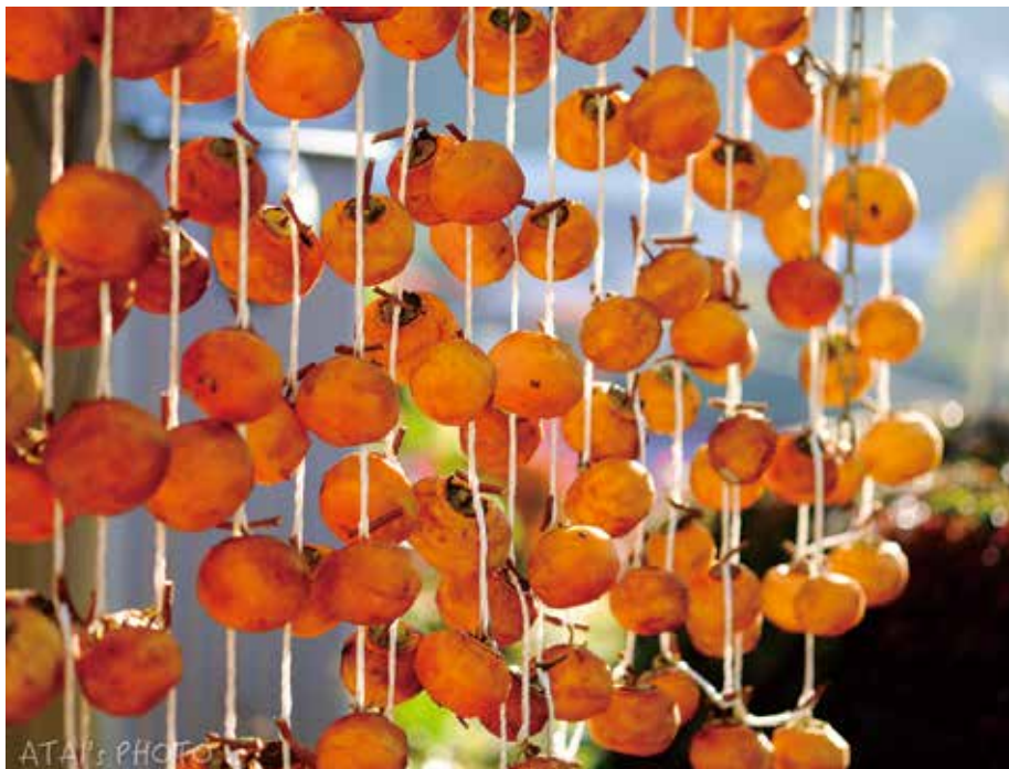
撮影データ：2021年11月7日 二本松市東新殿 FUJIFILM X-T1+XF60mmF2.4R Macro (f/2.4 絞り優先オート)

【吊るし柿】 山里の秋は駆け足で通り過ぎて行きます。そんな晩秋の風物詩でもあります。