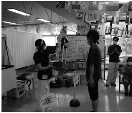
紅組に贈られた優勝トロフィー

■運動会 大盛り上がり ゴールドメディアでは、10月14日(木)に施設内で通所リハビリ大運動会を開催しました。今年のテーマは「絆と気合い、仲間を信じて心をひとつに頑張ろう!」。競技は