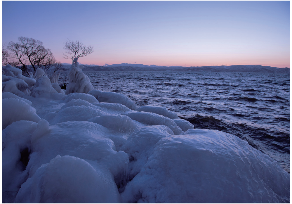
撮影データ：2017年1月23日 猪苗代町天神浜 Nikon D750 + AF-S NIKKOR 24-120mm F4G 絞り優先オート