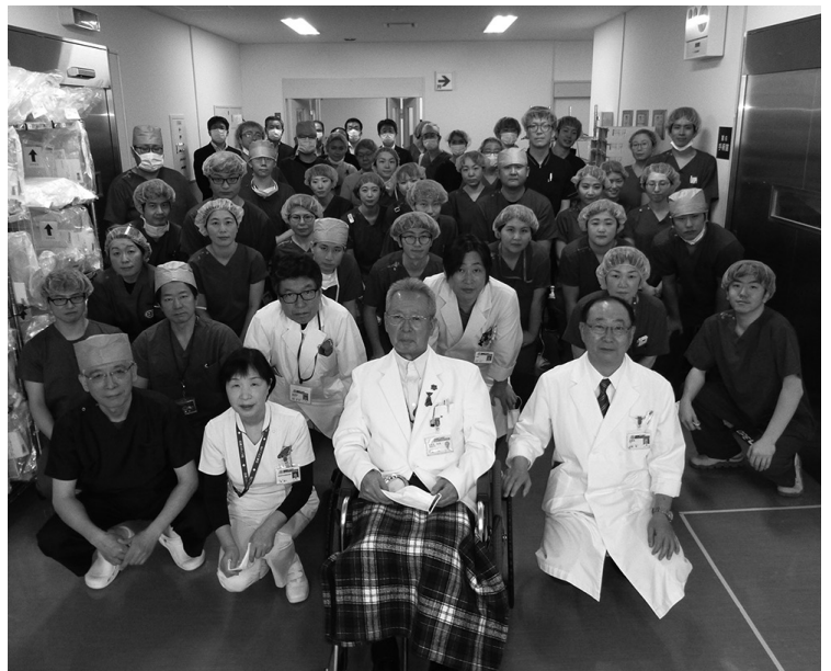
手術の無事故に決意を新たにする関係者