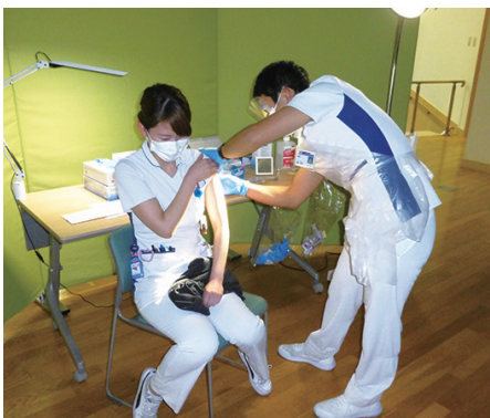
3回目のワクチン接種を受ける職員（2021年12月20日）

新型コロナウイルス感染症の第6波の先行きが懸念される中、総合南東北病院の北棟NABEホールで3回目の新型コロナウイルスワクチンの集団接種