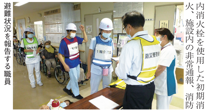
避難状況を報告する職員

介護老人保健施設ゴールドメディアは昨年12月23日(木)午後2時から施設内で、夜間想定避難訓練を行いました。今回は火災発生場所を知らずに実施。自動火災警報器が鳴り「ただ今、火災報知器が作動しました。職員は至急現場を確認してください。利用者さんは職員の指示があるまでその場でお待ちください」とアナウンスが流れました。間もなく職員が2階、施設長室から出火していることを確認。1階、2階の職員がそれぞれの役割に従って、屋