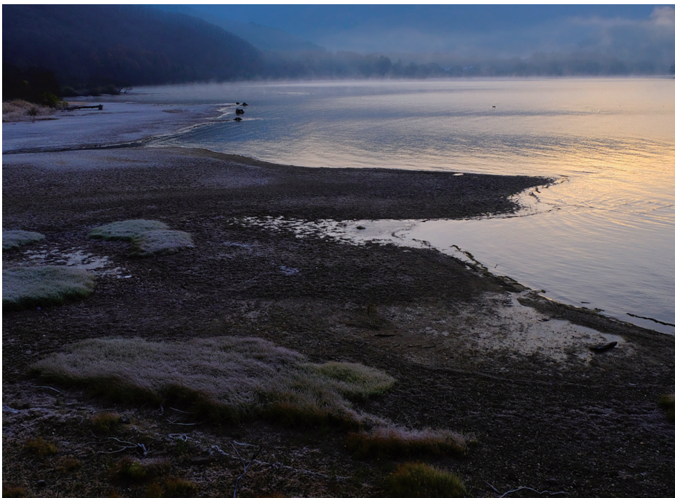
撮影データ：2021年11月21日 北塩原村松原湖 FUJIFILM X-T4+XF18-135mm (f/11 絞り優先オート、ISO 800)