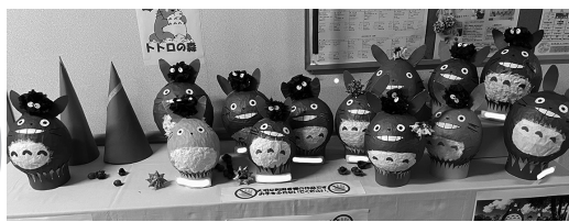
利用者さんが制作したトトロたち

さん。新聞紙や色紙の貼り付け、耳や目のパーツの取り付けなど、一度慣れてしまえばあっという間に作りあげてしまい、現在、通所リハビリには色とりどりで数多くのトトロが並んでいます。