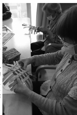
クラフトバンドで小物入れ作りに挑戦する入居者

創作工程の中で一番苦戦したのが、側面を編む作業でした。微妙なカーブを編んでいくのが難しく、「こうすればいいんじゃない？」と入居者さん同士でア