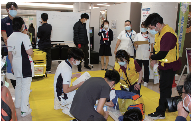
搬送された傷病者を処置する医師や看護師ら

URL: http://www.minamitohoku.or.jp E-mail: pr@mt.strins.or.jp