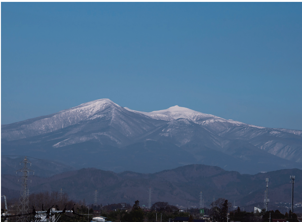
撮影データ：2022年1月10日 郡山市・総合南東北病院より Nikon D750 + NIKKOR 28-300mm (f/11 絞り優先オート、手持ち撮影)

【新春の安達太良山】 病院の屋上から見える安達太良山です。郡山市の北西に位置し、