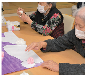
貼り絵を制作する利用者さん