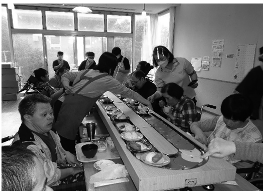
本格的な回転寿司を楽しむ利用者さん

総合南東北福祉センターでは毎年恒例の「お寿司の日」を今年も開催しました。本格的な回転寿司レーンを各事業所に設置し、利用者さんの昼食にお寿司を提供します。一週間かけて、センター内のす