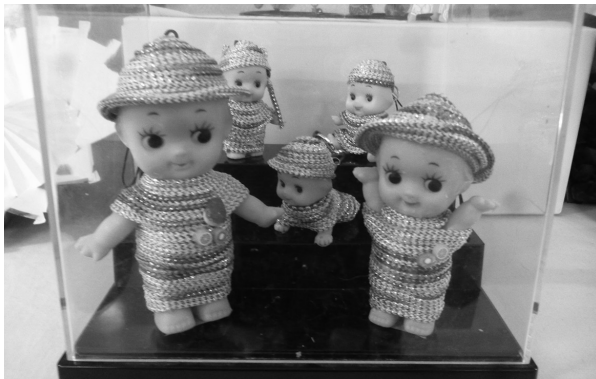
きらびやかな服で着飾られたキューピー人形

皆さん、元々手作業がお好きとのことで、ペットボトルの蓋を利用してリリアン編みで帽子のキーホルダーを作ったり、キューピー人形の洋服