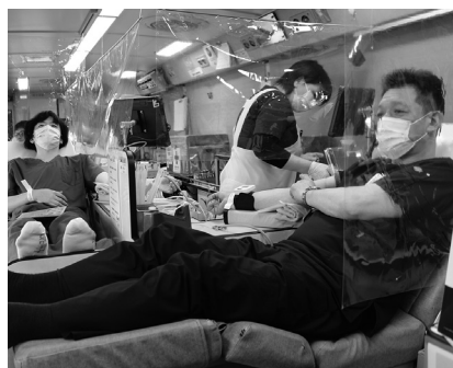
献血に協力する職員

県赤十字血液センターの担当者は「献血への協力に感謝します。今後も血液不足が予想されるので、多くの方に献血していただけたら嬉しいです」と話していました。