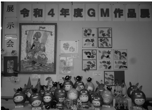
利用者さんの力作が並んだGM作品展

を制作したりしました。壁面には大勢の利用者さんによる折り紙の絵を貼って、様々な秋にちなんだ作品が飾られ、ゴールドメディア内も季節の移ろいを感じることができま