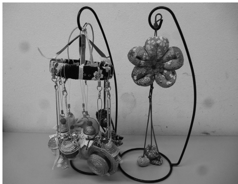
ペットボトルの蓋を利用したりリリアン編みのキーホルダー

を制作したりしました。壁面には大勢の利用者さんによる折り紙の絵を貼って、様々な秋にちなんだ作品が飾られ、ゴールドメディア内も季節の移ろいを感じることができま