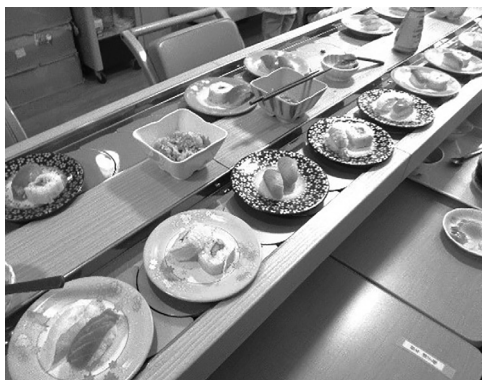
美味しくそうなネタでいっぱい回転寿司

べての事業所を巡回しました。今回の寿司ネタはマグロ、蒸しエビ、サーモン、タイなどの握りのほか、太巻きや卵ロールといった巻物、お吸い物やデザートも用意しました。