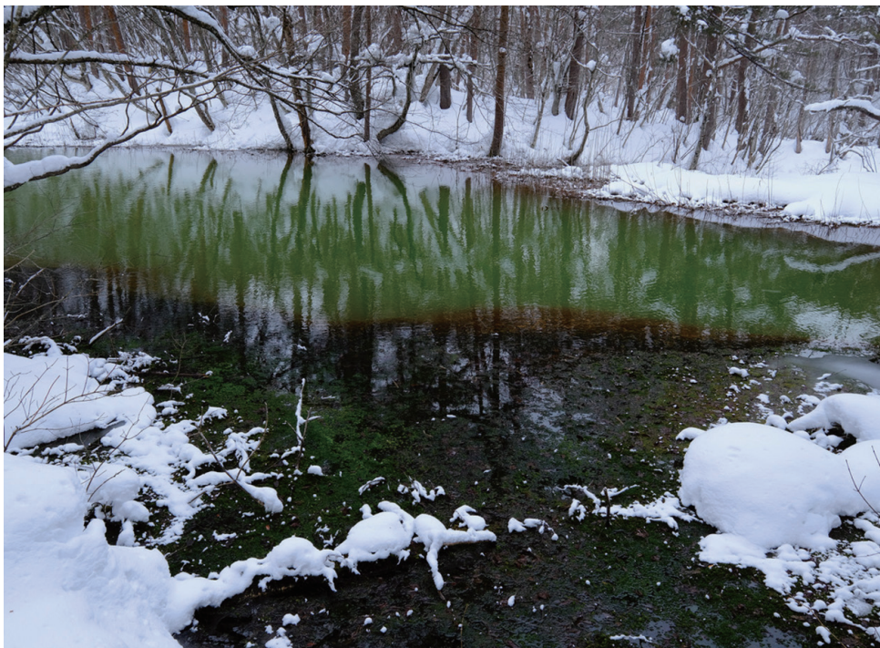
撮影データ：2022年1月30日 北塩原村 FUJIFILM X-T4 + XF10-24mmF4R (f/9 絞り優先オート)