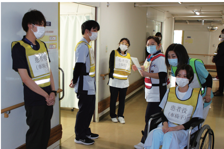
入院患者を安全な場所に誘導する看護師

その後、初期消火ができなかった報告を看護師が夜間看護部長へ連絡し、消防署への通報や緊急放送による他病棟の看護師への応援要請などを確認しました。避難開始の指示も出し、患者は看護師の誘導のもと、屋外の非常階段で地上まで避難。自力歩行できない患者は、看護師が車いすやベッドなどで安全な場所まで移動しました。